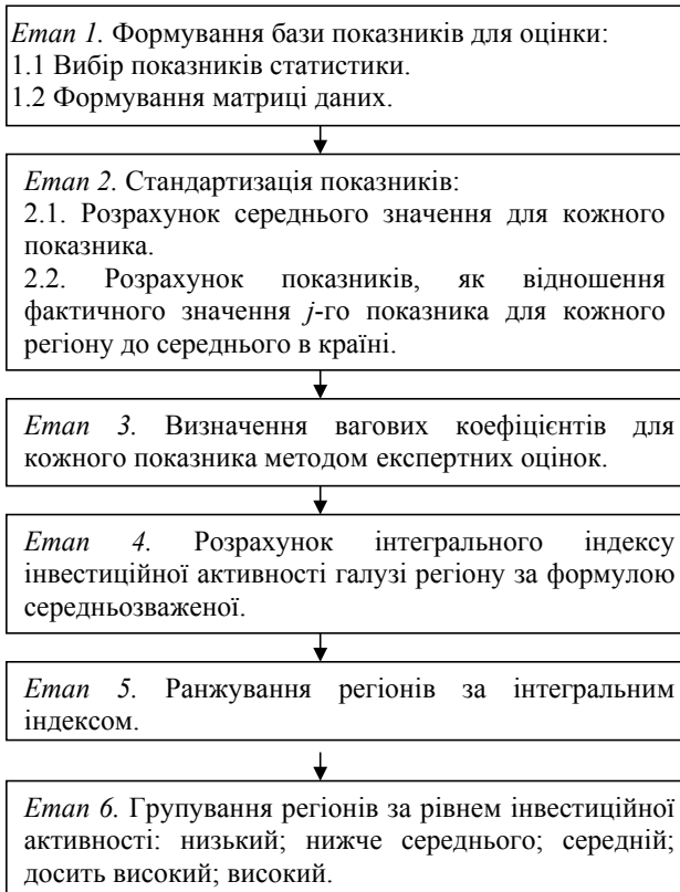
Рис. 1. Структурно-логічна схема оцінки інвестиційної активності галузі регіону

Тепер використаємо запропоновану методику для оцінки рівня інвестиційної активності в харчовій галузі регіонів України з метою розробки відповідних практичних рекомендацій для покращення регіонального інвестиційного процесу в даному секторі економіки. Також запропонована методика надає можливість не лише комплексно оцінити рівень інвестиційної активності в харчовій галузі регіонів України та визначити стратегічні напрями регулювання й обґрунтування управлінських рішень в сфері галузевої інвестиційної політики. Вихідна інформація для розрахунку представлена в таблиці 2.