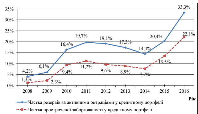
Рис. 3. Динаміка частки резервів за активними операціями та частки простроченої заборгованості в кредитному портфелі банків упродовж 2008–2016 рр. [1]

Стрімке збільшення частки проблемної заборгованості в кредитному портфелі банків зумовлює значні відрахування в резерви на покриття втрат за кредитними операціями. Чим більші суми відрахування в резерви під кредитні ризики водночас зі зростанням витрати банків на адміністрування проблемних кредитів, тим менш ефективно використовується банківський капітал. Проаналізуємо частку резервів за активними операціями та частку простроченої заборгованості у кредитному портфелі банків (рис. 3).