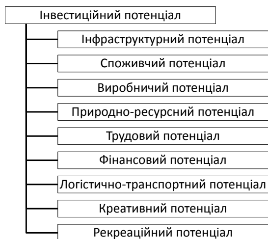
Рис. 1. Складові інвестиційного потенціалу

Виробничий потенціал – це сукупність вартісних і натурально-речовинних характеристик виробничої бази, що виражається в потенційних можливостях виробляти продукцію певного складу, технічного рівня і якості в необхідному обсязі.