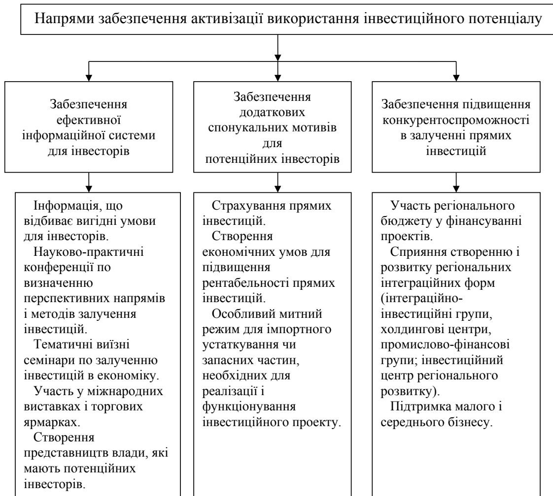
Рис. 2. Напрями забезпечення активізації використання інвестиційного потенціалу

І.М. Кіпіро також досить чітко описав особливості інвестиційної діяльності підприємств аграрного виробництва: