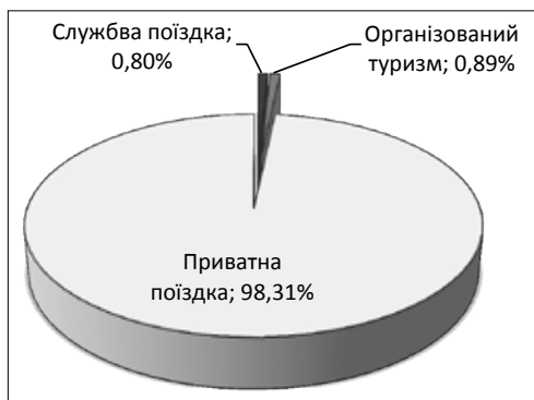
Рис. 1. Виїзд громадян України за кордон у 2015 р.

Актуально також розглянути коливання показників виїзду громадян України за останні п'ять років (рис. 2).