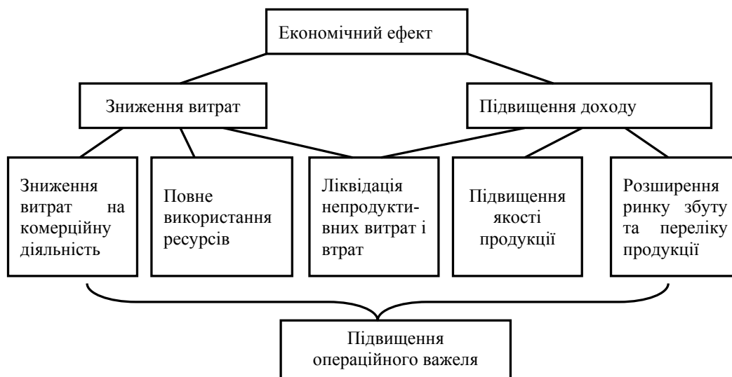
Рис. 2. Переваги від впровадження вертикальної інтеграції

МХП контролює всі етапи виробництва м'яса птиці – від вирощування зернових, виробництва комбікормів до інкубації яєць, вирощування бройлерного поголів'я, переробки, збуту, розподілу і продажів м'яса птиці (у тому числі через франчайзингові точки МХП). Вертикальна інтеграція дає змогу мінімізувати залежність МХП від постачальників і цін на сировину. Крім економічної ефективності, вертикальна інтеграція дає змогу МХП втілювати строгу політику біобезпеки, контролювати якість сировини і кінцеву якість та безпеку продукції до точок продажів.