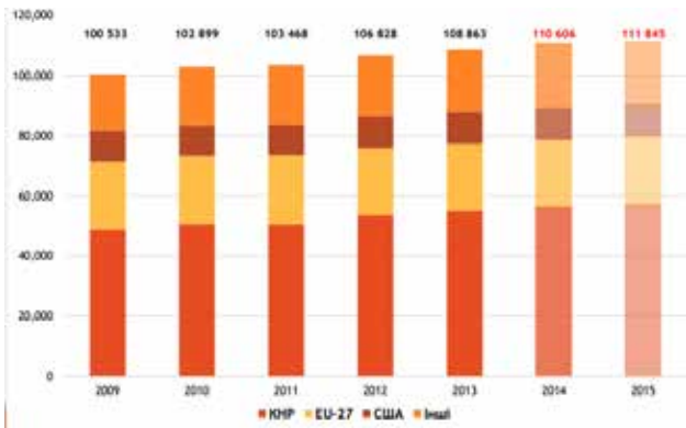
Рис. 1. Динаміка виробництва свинини у світі за 2009–2015 роки, тис. т.

свиней. Протягом 2015 року поголів'я свиней зменшилось на 422,5 тис. голів (або на 94,6%) та станом на 1 січня 2016 року дорівнювало 7 341,9 тис. голів. Також зазначимо, що в Дніпропетровській області поголів'я свиней зменшилось на 18,4 тис. голів (або на 96,6%) і на кінець 2015 року їх кількість дорівнювала 530,1 тис. голів, або 7,22% загальної кількості поголів'я свиней в Україні. Динаміка поголів'я свиней за період незалежності в Україні та Дніпропетровській області наведена на рис. 2.