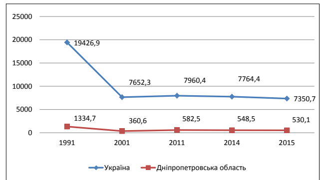
Рис. 2. Динаміка поголів'я свиней в Україні та Дніпропетровській області

Результати аналітичного огляду вирощування свиней за категоріями господарств говорять про те, що в 2015 році в Україні господарствам населення належить 49,2%, а