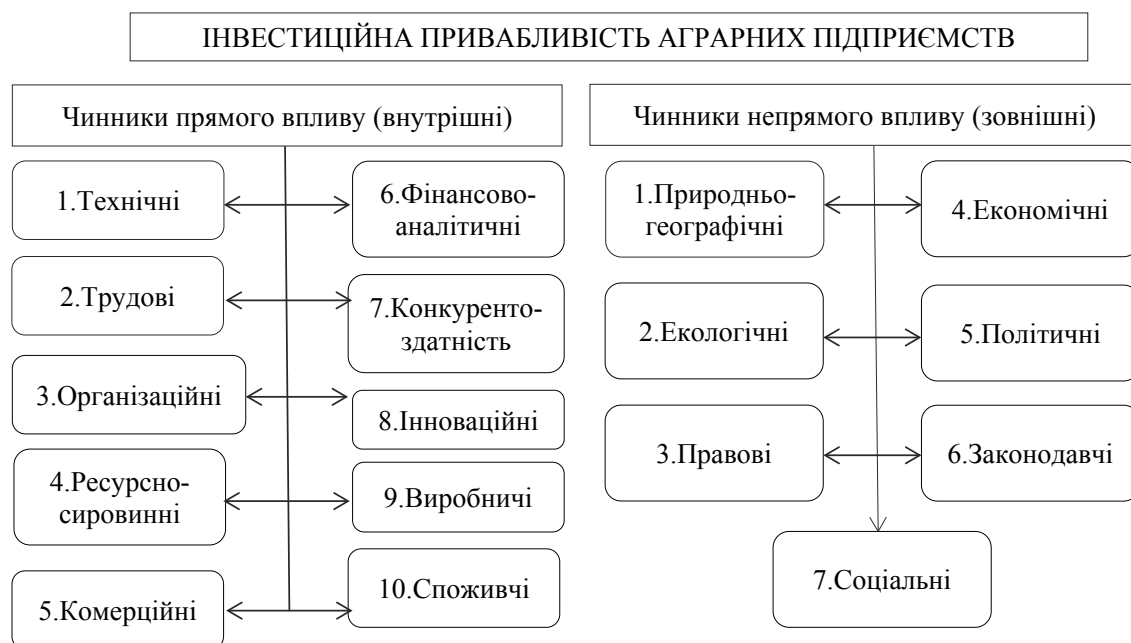
Рис. 1. Чинники зовнішнього та внутрішнього середовища, що впливають на інвестиційну привабливість [3, с. 124]

Інвестиційна привабливість аграрних підприємства відкриває нові можливості диверсифікації для вітчизняних та іноземних інвесторів, підвищує гарантію вкладення коштів іноземних інвесторів в інвестиційні проекти. Аналіз інвестиційної привабливості передбачає можливість виявити недоліки в діяльності підприємства, запропонувати заходи щодо їх