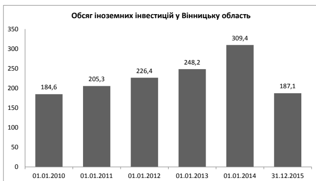
Рис. 3. Прямі іноземні інвестиції (акціонерний капітал) у Вінницькій області

У 2015 р. в економіку області іноземними інвесторами вкладено 5,3 млн. дол. США та вилучено 1,2 млн. дол. прямих інвестицій (акціонерного капіталу). Зменшення вартості акціонерного капіталу за рахунок переоцінки, втрат та перекласифікації становило 40,1 млн. дол., у тому числі за рахунок курсової різниці – 39,2 млн. дол.