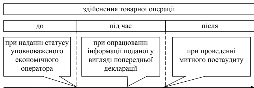
Рис. 1. Види аналізу ЗЕД аналізу митними органами ФРН за часом проведення