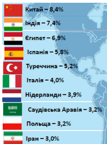
Рис. 3. Зовнішньоекономічна діяльність. Географічна структура експорту продовольчих товарів

Збільшилося постачання української агропродукції й у Туреччину та Ізраїль. На Туреччину в 2015 р. прийшлося 5,2% від загального експорту. У грошовому вимірі — це 762 млн дол. США та приріст в рік на 12,5%. Конфлікт між Росією та Туреччиною дає українським експортерам додаткові можливості. Позитивним виявився рік також для експорту в Ізраїль, з яким на сьогодні ведуться активні переговори щодо створення ЗВТ. Експорт до цієї країни збільшився на 4,8%, а також постачання сирів та йогуртів, яєць, зернових, пива, вина, спирту. Географічна структура експорту продовольчих товарів наведено на рис. 3.