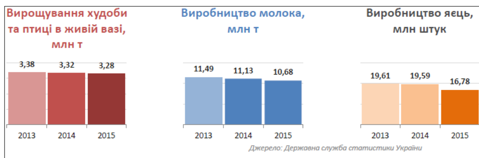
Рис. 1. Динаміка зміни виробництва продовольчої продукції за 2013–2015 рр.