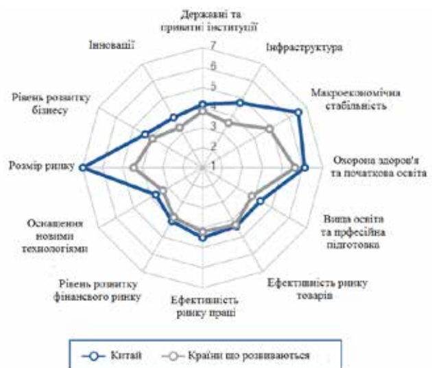
Рис. 1. Багатокутник глобальної конкурентоспроможності КНР, 2015 р.

Результати звіту про конкурентоспроможність доводять, що інноваційна сфера залишається пріоритетною для уряду Китаю і потребує подальшого розвитку. За останні роки було втілено в життя багато проектів та реформ для підвищення інноваційності економіки Китаю: постійно зростають витрати на дослідження та розробки (23-е місце в рейтингу); зростають витрати уряду на закупівлю передових технологій (10-е місце); уряд підтримує кооперацію університетів та приватного сектора у питаннях проведення досліджень, невпинно зростає обсяг високотехнологічного експорту та імпорту тощо. Завдяки такій злагодженій роботі уряду Китай із року в рік займає все вищі позиції за показниками інноваційності (рис. 1).