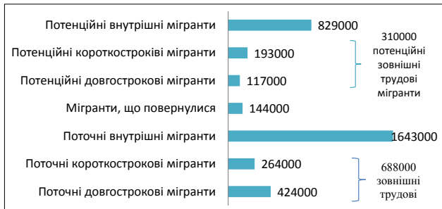
Рис. 1. Оцінка кількості українських трудових мігрантів (2014–2015 рр.) [2]

рилася на масове явище і джерело доходів для багатьох сімей. Відповідно до даних дослідження, проведеного в рамках проекту Міжнародної організації з міграції (МОМ) у 2014–2015 рр., за кордоном для здійснення трудової діяльності перебувають близько 700 тис. громадян України. Кількість трудових мігрантів зобразимо на рис. 1 [2].