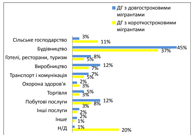
Рис. 3. Сфери зайнятості українських трудових мігрантів за кордоном [2]