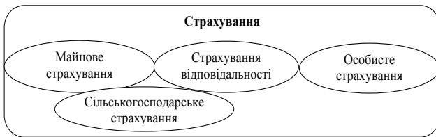
Рис. 1. Місце сільськогосподарського страхування в загальній системі страхування

між конкретними суб'єктами господарювання, де, з одного боку, виступають страховики – фінансово-кредитні установи, а з іншого – страховальники – сільськогосподарські підприємства, орендарі, селянські (фермерські) господарства, які за певну плату передають свої ризики майнових, фінансових утрат у сільськогосподарській діяльності для отримання відшкодування у разі настання страхового випадку.