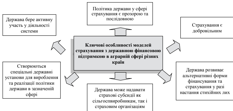
Рис. 4. Особливості моделей страхування з державною фінансовою підтримкою в аграрній сфері в різних країнах