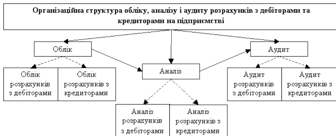
Рис. 1. Організаційна структура обліку, аналізу й аудиту розрахунків із дебіторами та кредиторами на підприємстві

класифікація дебіторської заборгованості за кожним покупцем або замовником, списання дебіторської заборгованості з балансу та ін. Це дасть змогу повніше висвітлювати питання організації бухгалтерського обліку та підвищити контроль над розрахунками з покупцями та замовниками [5, с. 40–44].