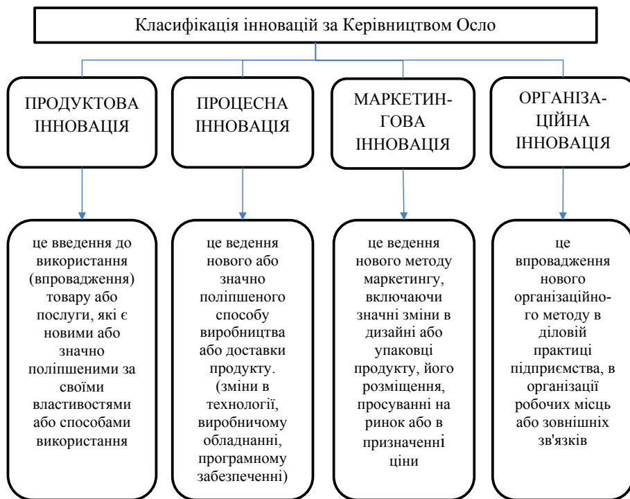
Рис. 2. Класифікація інновацій за Керівництвом Осло