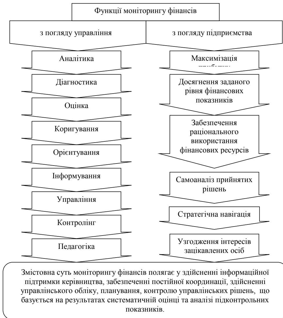
Рис. 1. Основні функції моніторингу фінансів щодо управління та цільового спрямування

Центральною функцією моніторингу фінансів є систематичне спостереження за координацією різних функціональних фінансових підсистем, що діють на підприємстві, зокрема