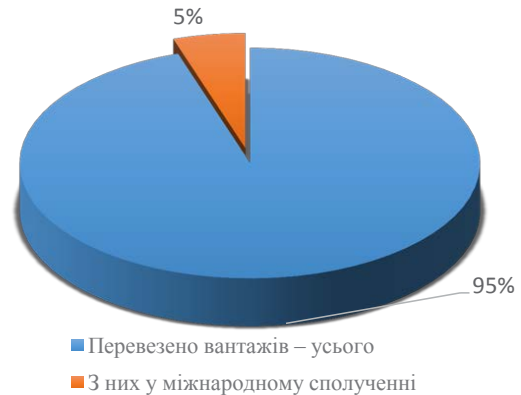
Рис. 2. Перевезення вантажів автомобільним транспортом у 2016 р., тис. грн.

робітництва, а саме розвивати з іншими країнами взаємовигідні партнерські стосунки, активніше інтегруватися у світове господарство. Україна вже є членом Міжнародного валютного фонду, Світового банку, Європейського банку реконструкції та розвитку, Світової організації торгівлі.