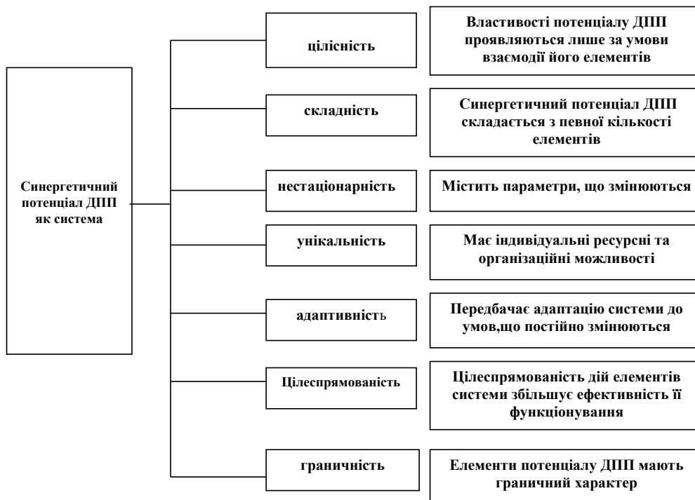
Рис. 1. Властивості синергетичного потенціалу ДПП як системи

З точки зору системного підходу синергетичний потенціал доцільно розглядати як систему, що характеризується наступними властивостями (рис. 1).