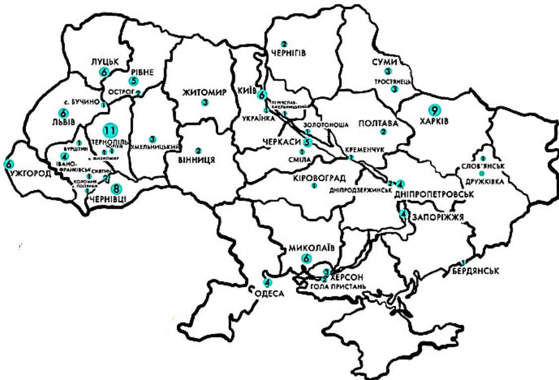
Рис. 2. Географія візитів учасників руху «Твоя країна» станом на 1 березня 2016 р.

Сучасний стан користування мережами гостинності подібних Airbnb в Україні характеризується недостатнім вибором для користувачів. Ця проблема спричинена тим, що ресурс вимагає від власників документів, які свідчать про те, що вони ведуть цей бізнес легально і платять податки. Сьогодні близько 80% власників здають житло в оренду за готівку, уникаючи оподаткування. Виходячи з цього,