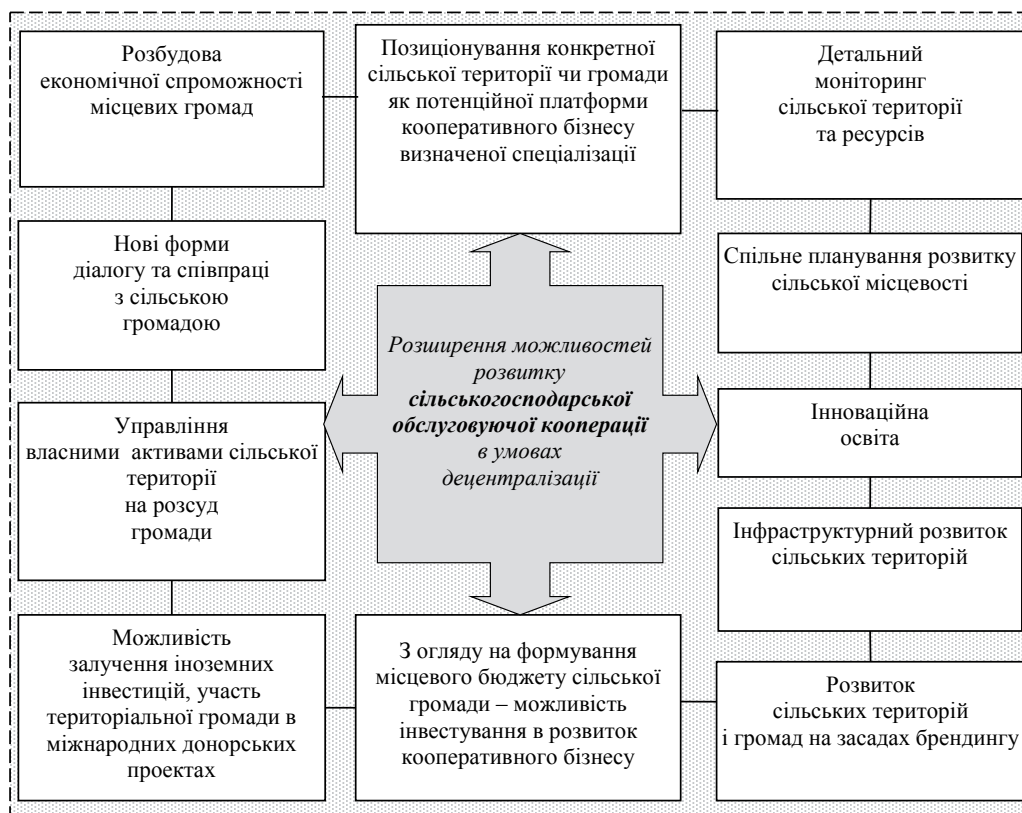
Рис. 2. Організаційно-економічні передумови розширення можливостей розвитку сільськогосподарської обслуговуючої кооперації в умовах децентралізації

буваються сьогодні в Україні. Йдеться насамперед про децентралізацію влади, що значно розширює можливості розвитку сільських громад. Загалом трансформаційні зрушення в системі місцевого самоврядування комплементарні