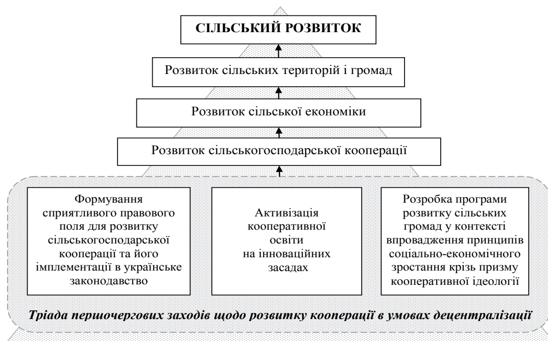
Рис. 3. Місце сільськогосподарської обслуговуючої кооперації в сільському розвитку