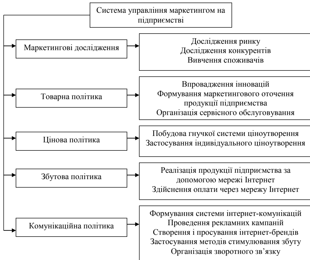
Рис. 2. Побудова системи управління маркетингом лісового підприємства в Інтернеті

Незважаючи на розмаїття електронних товарів, вони мають схожі риси, що дає змогу віднести їх до особливої категорії товарів. На цій основі пропонуємо для лісових підприємств електронні товари поділити за такими категоріями: