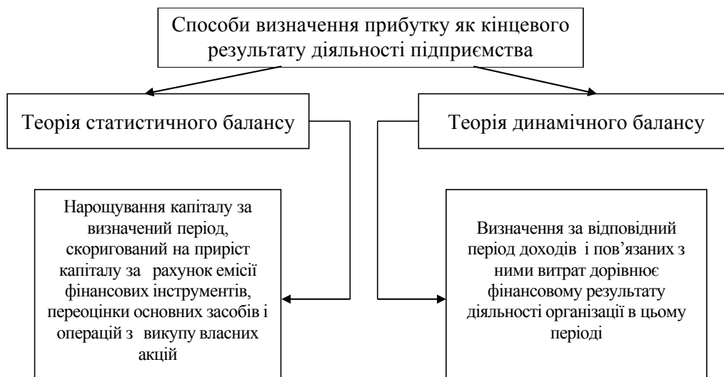
Рис. 1. Способи визначення прибутку як кінцевого результату діяльності підприємства

Висновки. На основі проведеного дослідження можна визначити, що фінансовий результат підприємства може відображати ступінь його вдалої діяльності у разі одержання прибутку та ступінь невдачі проведення фінансово-господарської діяльності в разі одержання збитку. Прибуток підприємства – це особлива економічна категорія, адже саме прибуток дає змогу підприємству стимулювати виробничий процес, проводити фінансову, інвестиційну діяльність. Величина прибутку повинна бути достатньою для задоволення виробничих та інших потреб підприємства. В одержанні прибутку зацікавлені не лише власники і робітники підприємства, а й держава, оскільки за допомогою податків, сплачених підприємством, держава виконує свої основні функції. Таким чином, можна стверджувати, що позитивний фінансовий результат, тобто прибуток підпри-