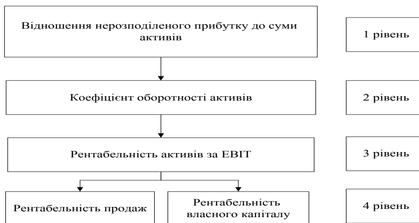
Рис. 2. Ієрархія напрямів реалізації моделі діагностики фінансового стану підприємства щодо підвищення фінансової стійкості підприємства

На найвищому рівні ієрархії перебуває відношення нерозподіленого прибутку до суми акти-