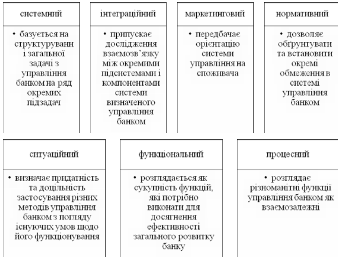
Рис. 1. Наукові підходи до організації фінансового менеджменту