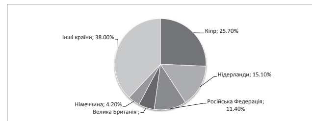
Рис. 1. Структура прямих іноземних інвестицій (акціонерного капіталу) в економіку України за країнами за 2016 рік, %

Загалом обсяг прямих іноземних інвестицій (далі ПІІ) в економіку України у 2016 році склав 37,7 млрд. дол. США, що є менше рівня попередніх 5-ти років. Зменшення пояснюється деструктивними змінами в геополітичному стані держави перш за все, адже окупованою є територія Криму та фактично здійснюється проведення антитерористичної операції на Сході країни, що створює негативні тенденції в сенсі інвестиційної привабливості. ПІІ за даними 2016 року надходили з 93 країн світу, серед яких чільне місце з огляду на питому вагу обсягів інвестицій займають: Кіпр – 9,7 млрд. дол. США, Нідерланди – 5,7 млрд. дол. США, Російська Федерація – 4,3 млрд. дол. США, Велика Британія – 2,1 млрд. дол. США та Німеччина – 1,6 млрд. дол. США (рис. 1) [4].