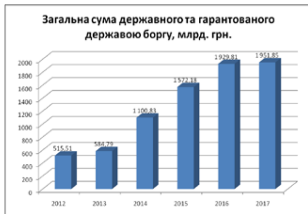
Рис. 1. Загальна сума державного гарантованого державою боргу за 2012–2017 рр. (млрд. грн.)

Відповідальність за розподіл та ефективне використання міжнародних фінансів, що поступають в Україну, а також за розрахунок сум гарантованого боргу несе держава (рис. 1).