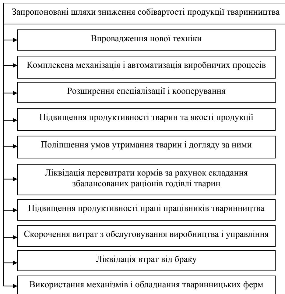
Рис. 3. Розроблені напрями зниження собівартості продукції тваринництва

дів. Джерелами формування виробничих витрат є виробничі ресурси, які використовуються у виробничому процесі. Для оптимізації обліку витрат на виробництво продукції тваринництва доцільно запровадити такі рекомендації. Зокрема, удосконалити первинний, синтетичний та аналітичний облік витрат продукції тваринництва, а також налагодити його організацію; запровадити схему управління витратами на виробництво продукції тваринництва, а також розробити напрями зниження рівня собівартості тваринницької продукції.