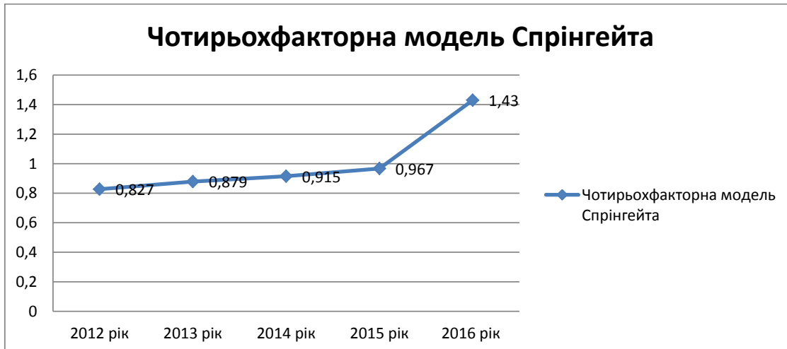
Рис. 2. Графік імовірності настання кризового стану та загрози банкрутства ТОВ «Агат Косметика» за моделлю Спрінгейта