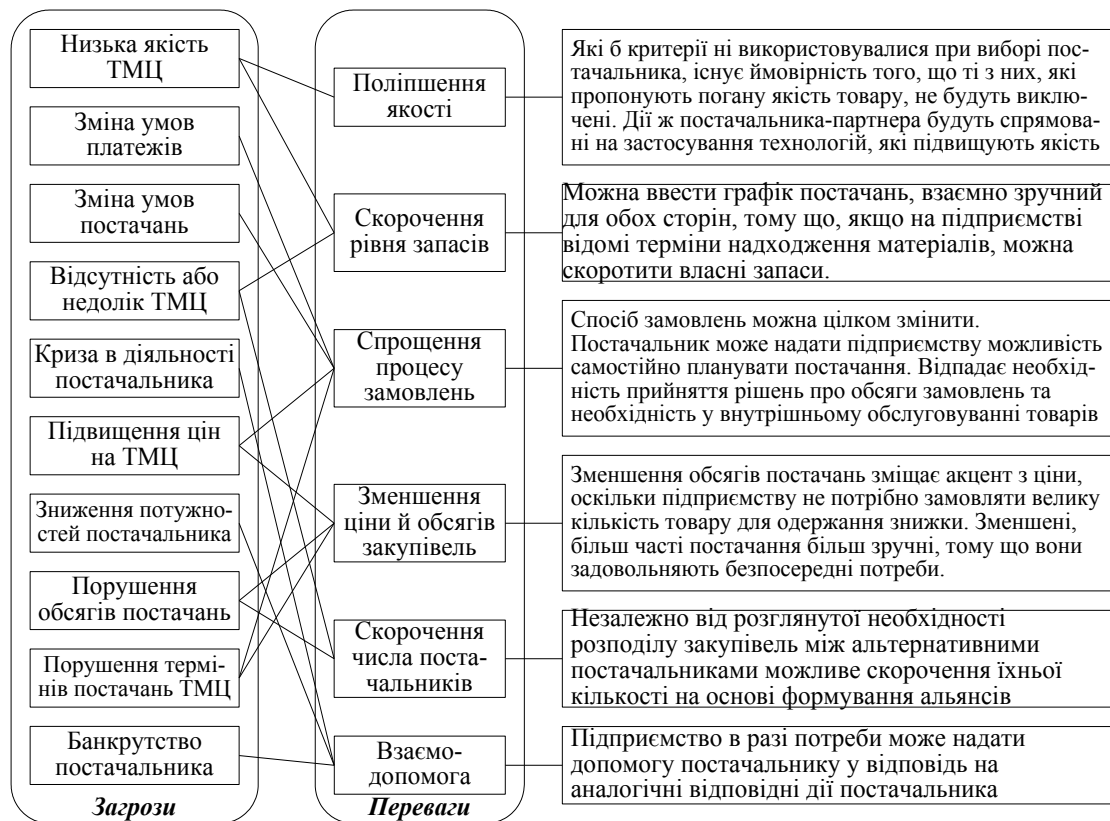
Рис. 3. Нейтралізація загроз шляхом встановлення партнерських відносин з постачальником

емства. Таким чином, мірилом якості послуги може бути тільки задоволеність споживачів. Якщо споживач задоволений, послуга – якісна. Якість у такому розумінні не може мати абсолютної оцінки. Будь-які кількісні показники якості є відносними й існують у формі рейтингів, оцінок невідповідностей, оцінок ступеня відповідності стандартам тощо.