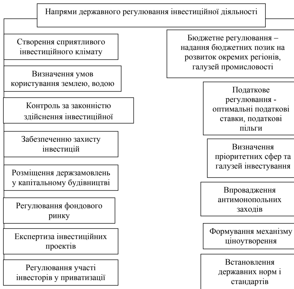
Рис. 1. Основні напрями державного регулювання інвестиційної діяльності

Проводячи аналіз стану правової бази здійснення інвестиційної діяльності, інвестиційного середовища, в цілому та інвестиційного клімату надає підстави побачити джерело негативного впливу в інвестиційній сфері України. До негативних характеристик інвестиційної сфери України можна віднести: