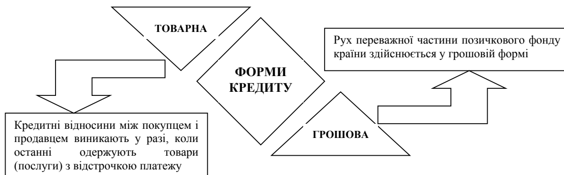
Рис. 1. Форми кредиту та їх економічна сутність

Проте так ставити питання можна лише стосовно окремої позички. Кредит же – процес безперервного руху вартості, і виділення двох його форм досить для характеристики кредиту як процесу.