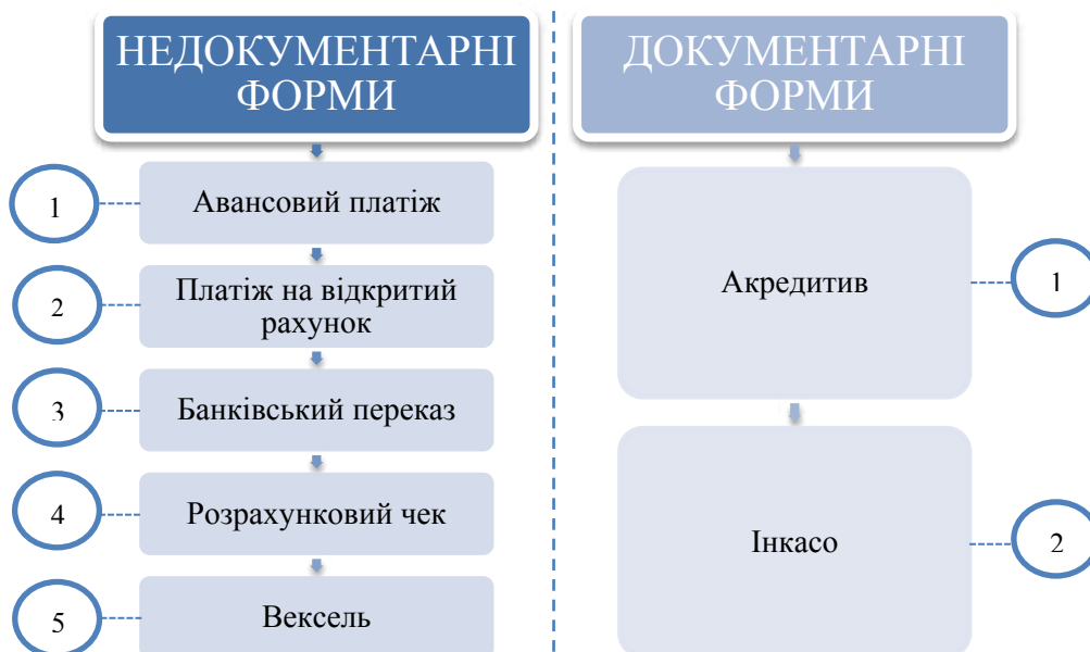
Рис. 3. Форми міжнародних розрахунків [1, с. 11–12; 2]

ведення діяльності між іноземними компаніями та їх представництвами, дочірніми компаніями в Україні, філіалами і спільними підприємствами. На практиці це пов'язано з тим, що такі розрахунки можливі лише якщо компанія має контроль над своїм контрагентом в Україні.