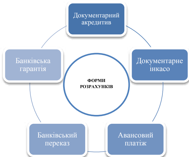
Рис. 4. Форми міжнародних розрахунків, що використовуються українськими підприємствами [1, с. 11–12; 2]

ної Європи, Північної Америки, Японією. Це пов'язано з тим, що ці регіони враховують підвищений ризик України в політичній та економічній сферах і низьку платоспроможність українських партнерів. Під час експортних розрахунків із країнами третього світу українські компанії та банки також використовують акредитиви, зважаючи на низьку платоспроможність таких країн-партнерів.