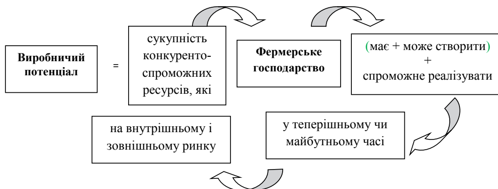
Рис. 1. Логічно смислова схема структури виробничого потенціалу фермерських господарств

Без сумніву, що можливості фермерського господарства розкриваються через кількісний та якісний склад ресурсів, їх оптимальну структуру й уміння раціонально використовувати територіальні особливості, природні умови, традиції, які склалися у виробничих