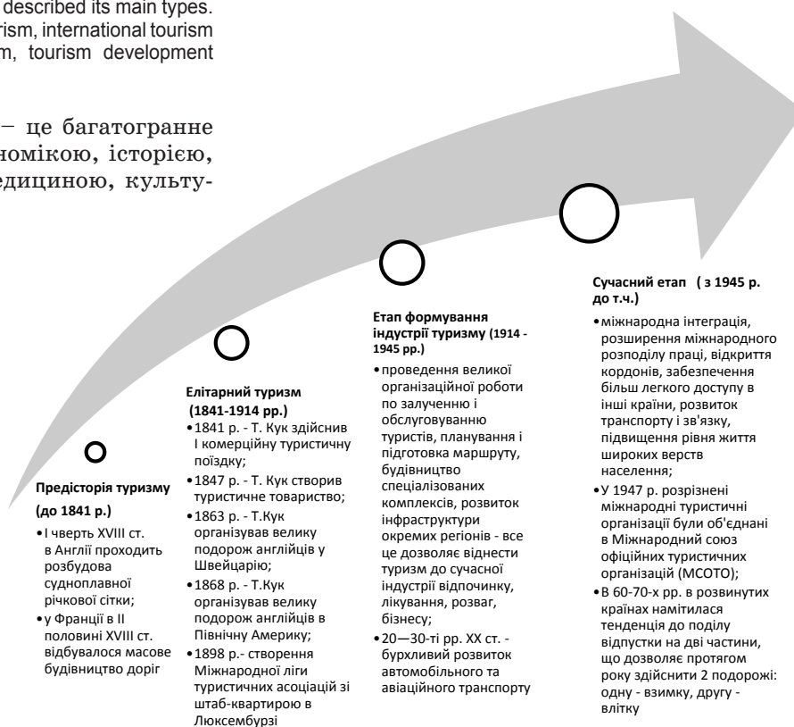
Рис. 1. Етапи розвитку туризму [15]

В середині ХХ століття уряди багатьох країн світу звернули серйозну увагу на розвиток туризму, і в 1947 р. розрізнені міжнародні туристичні організації були об'єднані в Міжнародний