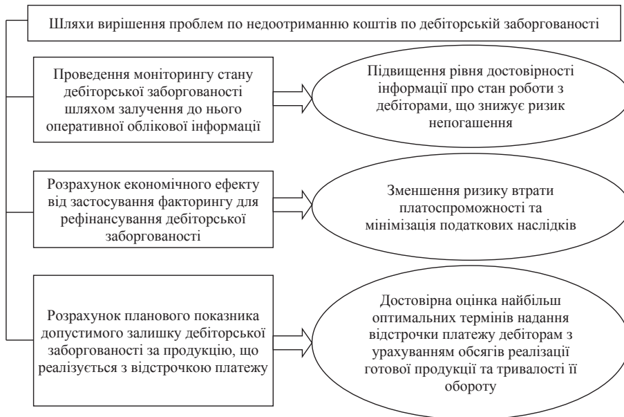
Рис. 1. Шляхи вирішення проблем по недоотриманню коштів по дебіторській заборгованості

стійний моніторинг заборгованості, своєчасно висувати претензії щодо виниклих боргів та попереджувати їх виникнення у майбутньому.