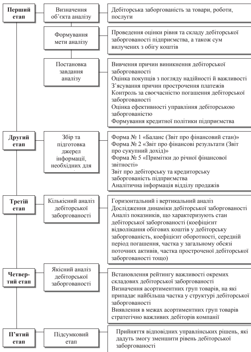
Рис. 2. Напрями і види аналізу дебіторської заборгованості

Використання запропонованої методики сприятиме посиленню економічного ефекту від реалізації товарів і прискоренню отримання грошових коштів від дебіторів.