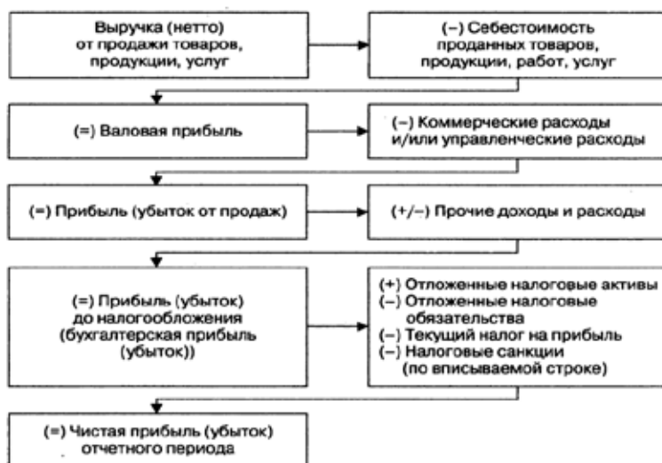
Рис. 1.1. Порядок формирования финансового результата

Бухгалтерская прибыль (убыток) является конечным финансовым результатом, выявленным в отчетном периоде на основании бухгалтерского