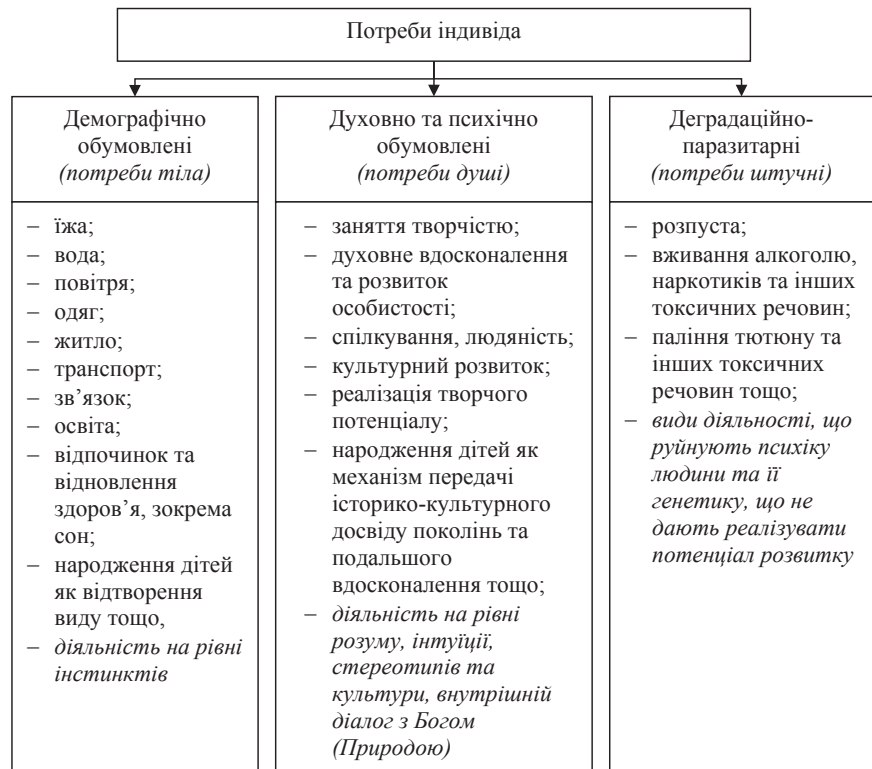
Рис. 1. Потреби індивідів в суспільстві

При цьому скорочення виробничого потенціалу значною мірою торкнулося громадського сектору, тоді як особисті селянські господарства і домашні господарства населення характеризувалися великим рівнем стійкості і проявляли тенденції щодо нарощування обсягів виробленої продукції. Такими виявилися виробництво картоплі (97% від загального виробництва в країні), овочів, плодів і ягід, молока і продукції вівчарства (86%, 82%, 78% і 85% від загальнодержавного виробництва відповідно).