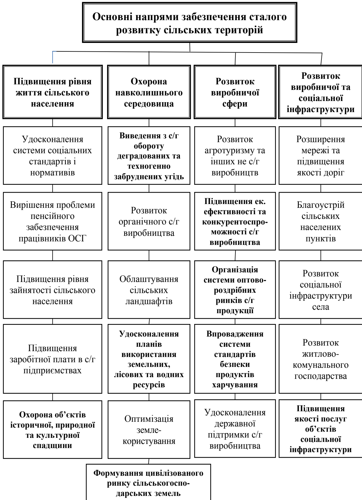
Рис. 2. Основні напрями забезпечення сталого розвитку сільських територій