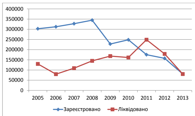
Рис. 2. Динаміка показників реєстрації фізичних осіб – підприємців та припинення їхньої діяльності [6]

Наступна діаграма (рис. 2) виражає динаміку показників реєстрації фізичних осіб – підприємців (ФОП) та припинення їхньої діяльності в Україні.