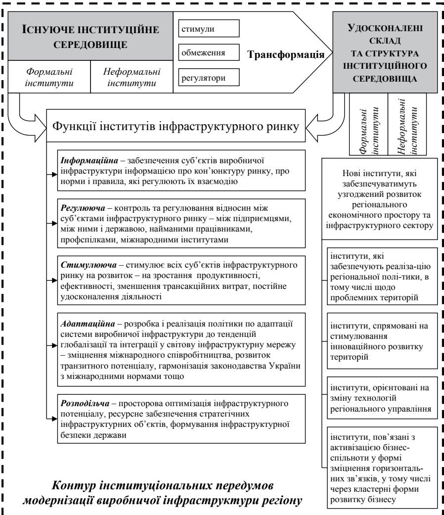
Рис. 3. Концептуальна схема формування передумов модернізаційних процесів через трансформацію існуючого інституційного середовища