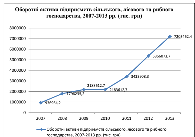
Рис. 2. Структура оборотних активів підприємств сільськогосподарського, лісового та рибного господарства у Львівській області, тис. грн. [5; 6]

Ефективне використання оборотних активів визначає ліквідність і платоспроможність підприємств, локалізованих у сільській місцевості, а також веде до стійкого економічного зростання сільських територій (рис. 2).