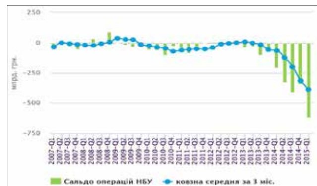
Рис. 2. Сальдо операцій НБУ (підтримка – мобілізація) у 2007 – I кв. 2015 р., млрд грн

Якщо на 1 січня 2015 р. норматив миттєвої ліквідності (значення не менше 20%) склав 57,13%, то на 1 травня 2015 р. показник зменшився до 50,49%. Норматив поточної ліквідності (значення не менше 40%) на початок 2015 р. був 79,92%, а на 1 травня 2015 р. становив 72,07%. Норматив короткострокової ліквідності (має бути не менше ніж 60%) на 1 січня 2015 р. становив 86,14%, а на 1 травня 2015 р. зменшився до 76,93%. Різне зниження нормативів ліквідності спостерігається саме з моменту підвищення облікової ставки до 30%, тобто ці дані є підтвердженням виконання завдання монетарної програми, що передбачає абсорбцію надлишкової ліквідності.