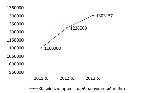
Рис. 3. Динаміка кількості хворих людей на цукровий діабет в Україні за 2011–2013 рр.

Більшість респондентів пов'язує необхідність використання цукрових заміників зі станом здоров'я, зокрема наявністю хвороби – цукровий діабет. Дійсно, така інформація підтверджується кількістю хворих в нашій країні, що наочно демонструє рис. 3. Наприклад, у 2013 р. кількість хворих на цукровий діабет становила 1 млн 303 тис.157 осіб, що на 18,5% більше ніж у 2011 р.