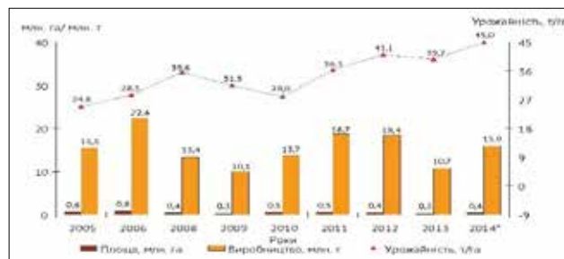
Рис. 2. Порівняльний аналіз виробництва цукрових буряків в Україні за 2005–2014 рр.

ною економічною кризою, яка і призвела до занепаду провідної рослинницької галузі буряківництва, сприяла руйнуванню матеріально-ресурсного потенціалу цукрової промисловості, зумовила витіснення вітчизняних товаровиробників із зовнішнього продовольчого ринку. Окрім наведеного вище, сьогодні набуло стійкої тенденції скорочення посівних площ цукрових буряків, а також помітне коливання рівня їх урожайності та зменшення обсягів валових зборів цукрової сировини, що, зокрема, демонструє рисунок 2.