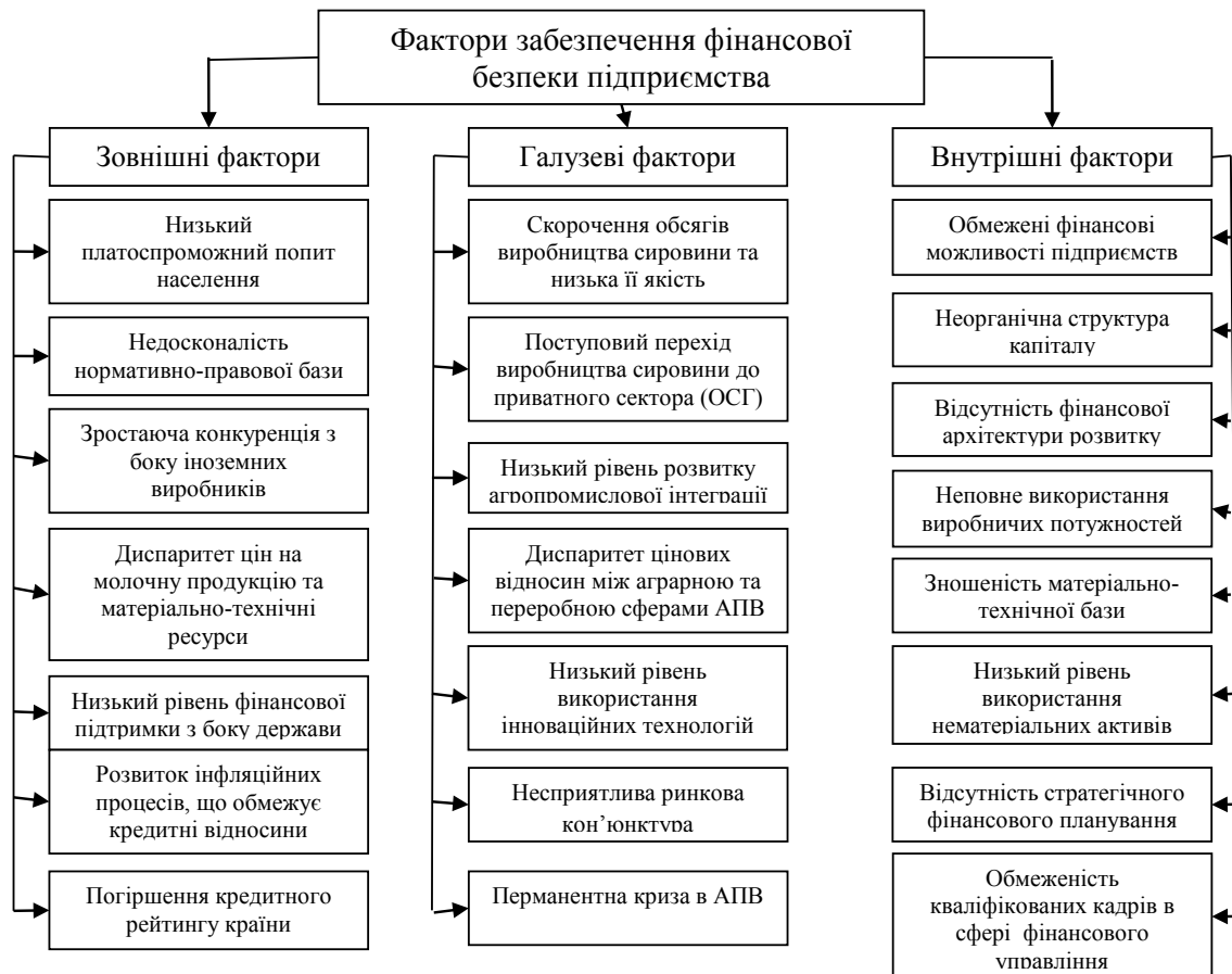
Рис. 1. Фактори забезпечення фінансової безпеки підприємств АПВ

1) достатність фінансових ресурсів для забезпечення фінансової стабільності діяльності підприємства;