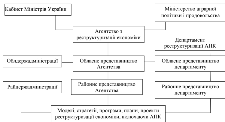
Рис. 4. Структура управління процесами реструктуризації на державному рівні

грації (об'єднання, злиття, поглинання) окремих суб'єктів господарювання в більш потужні об'єднання з метою отримання прибутку від масштабу виробництва (табл. 1).