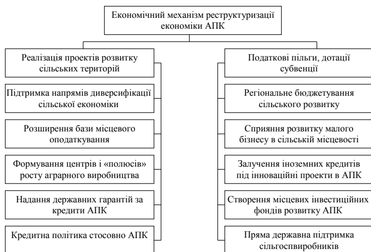
Рис. 5. Структурний зміст економічного механізму реструктуризації підприємств АПК у територіальних утвореннях