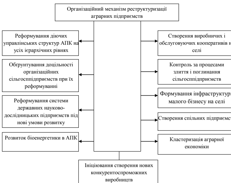
Рис. 3. Структура та зміст організаційного механізму реструктуризації аграрних підприємств

і регіональному рівнях. Узагальнення підходів щодо їх обґрунтування дозволяє визначити наступну їх структуру в узагальненому вигляді (рис. 1).