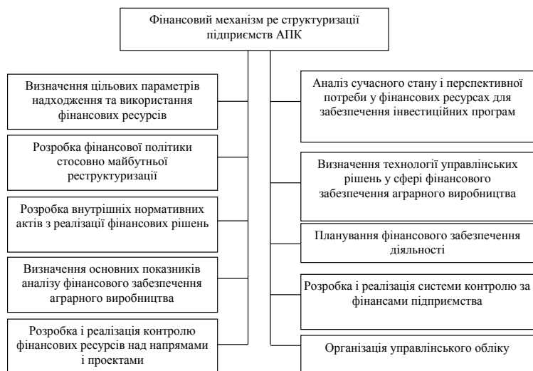
Рис. 6. Структура та зміст фінансового механізму реструктуризації аграрних підприємств

При цьому виникають непрості проблеми обґрунтування доцільності тих чи інших інтеграцій з точки зору економічної вигоди та дотримання вимог існуючого господарського законодавства. Як правило, ці відносини включають: дотримання справедливості між учасниками об'єднання; визначення системи взаєморозрахунків, виходячи із внеску кожного учасника в загальний прибуток інтегрованого об'єднання; закріплення договірних взаємовідносин та міжгосподарської взаємодії; розробка системи ціноутворення і кредитування учасників об'єднання.