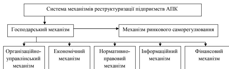
Рис. 1. Структура механізмів сприяння реструктуризації аграрних підприємств

Виклад основного матеріалу дослідження. Відсутність системного підходу щодо формування і реалізації довгострокової перспективи реструктуризації аграрного виробництва та підприємств і виробництв у цій системі багато чому залежить від використання напрацьованих вітчизняною наукою і практикою механізмів управління цими процесами на державному