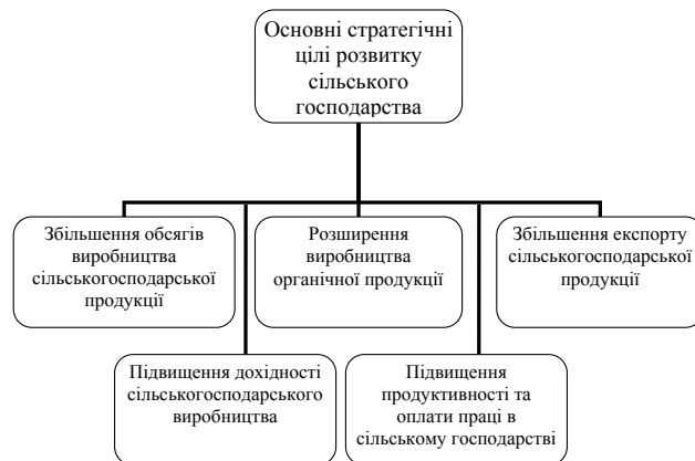
Рис. 2. Основні стратегічні цілі розвитку сільського господарства

Нами представлено на рисунку 2 основні стратегічні напрями покращення ринкових можливостей сільськогосподарських підприємств.