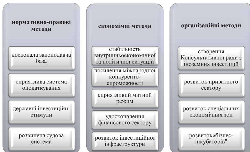
Рис. 2. Напрями активізації залучення прямих іноземних інвестицій в економіку України

Важливим напрямом активізації інвестиційної політики є організація та створення бізнес-інкубаторів – структур для підтримки малих підприємств на початковому етапі їх діяльності. Стандартний перелік послуг резидентам: безкоштовні офісні приміщення (або здають за пільговою ціною), переговорні кімнати, допомога у встановленні зв'язків з інвесторами та