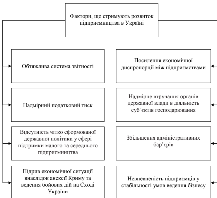
Рис. 1. Фактори, що стримують розвиток підприємництва в Україні

VII етап (2014–2015 рр.) характеризується рядом негативних факторів, що вплинули не тільки на діяльність підприємства, а й на економіку України взагалі. До них відносяться: політична нестабільність у 2014 році, анексія Криму та ведення бойових дій на Донбасі. Результатом таких явищ стало падіння ВВП України більше