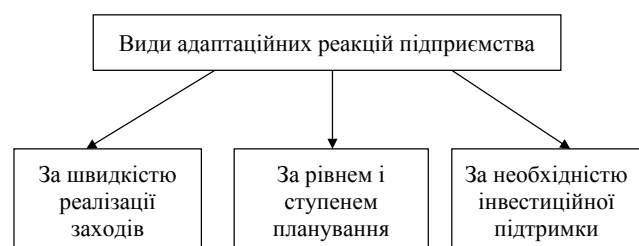
Рис. 2. Види адаптаційних реакцій підприємства