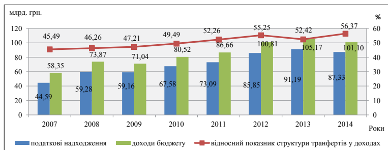
Рис. 2. Динаміка формування місцевих бюджетів

В рамках процесу децентралізації фінансових ресурсів, починаючи з 2015 р., з державного бюджету до місцевих передано 10 % ППП приватного сектору економіки, що за попередніми розрахунками на 2015 р. надасть 3,1 млрд. грн. додаткових коштів. До доходів загального фонду місцевих бюджетів передано