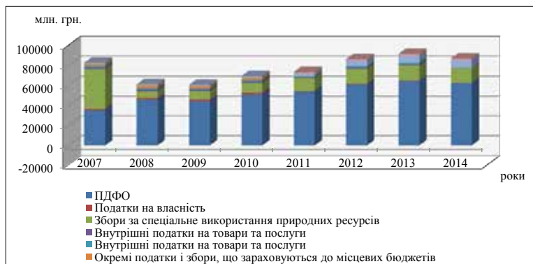
Рис. 3. Динаміка формування місцевих бюджетів