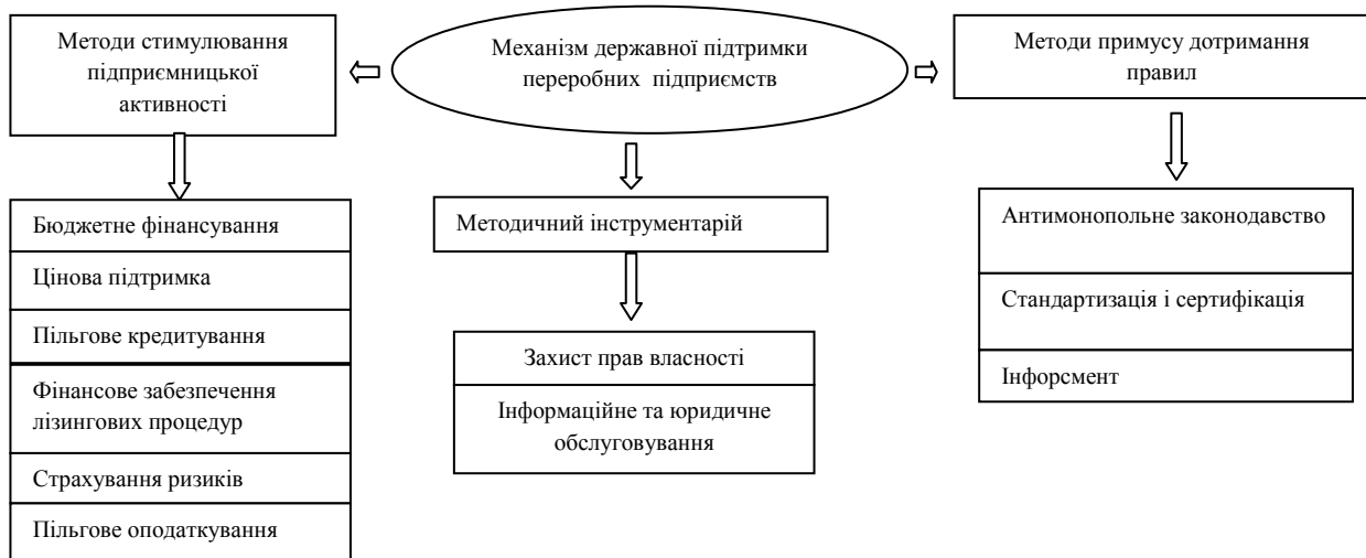
Рис. 2. Механізм державної підтримки переробних підприємств

Державна підтримка аграрного сектору України здійснюється за наступними напрямками [3, с. 156]: